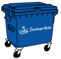
Umleerbehälter: 1.100 l